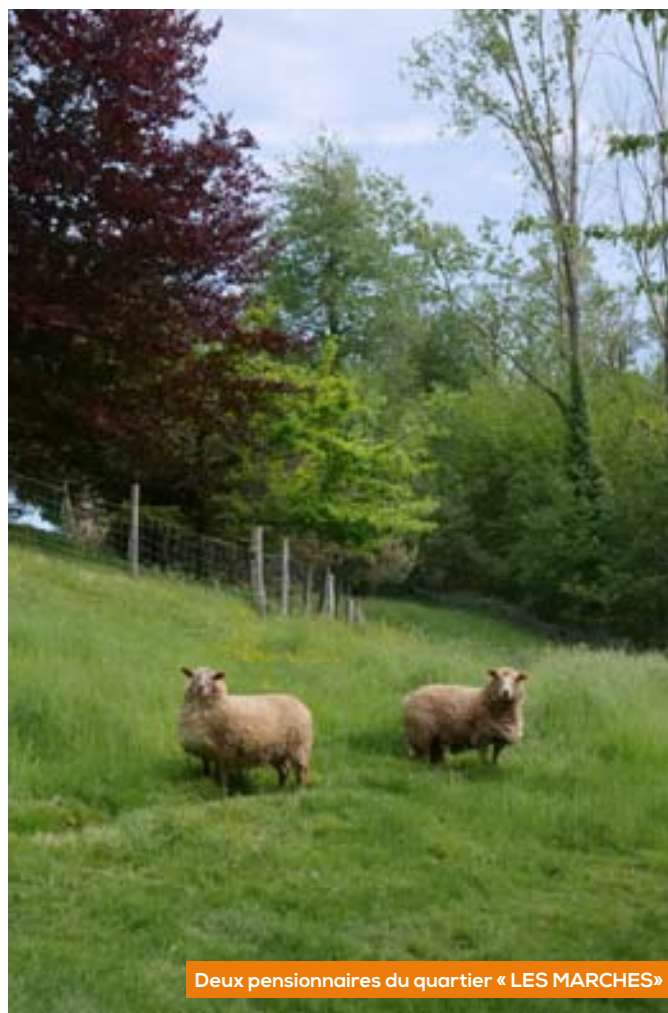
Deux pensionnaires du quartier « LES MARCHES »

Directeur de publication : Christian PETREQUIN, Rédaction : Mairie de Moidieu-Détourbe, Chef de Projet, Maquettiste : Gilles ROZIER, Coordination : Romaric PETIT / romaric.petit@moidieu-detourbe.fr